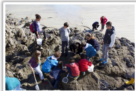
Observations sur l'Estran rocheux St Lunaire