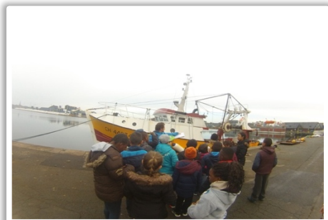
Excursion Saint Malo ou Granville