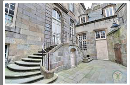
Visite d'une demeure et d'un bateau corsaire