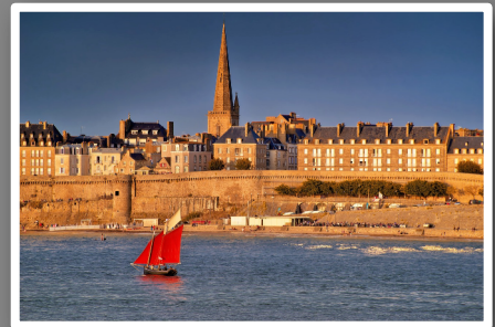
Rallye sur les remparts de St Malo