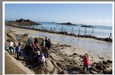
Observations sur l'Estran